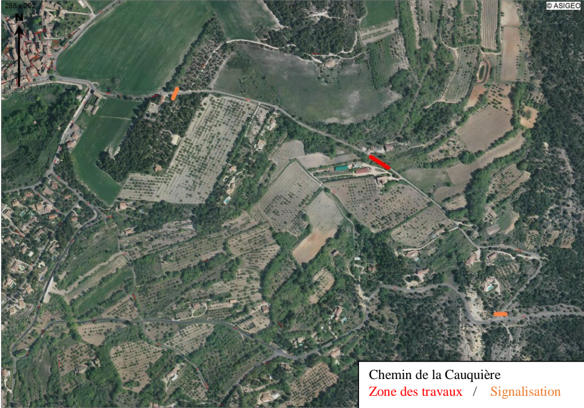
Chemin de la Cauquière Zone des travaux / Signalisation